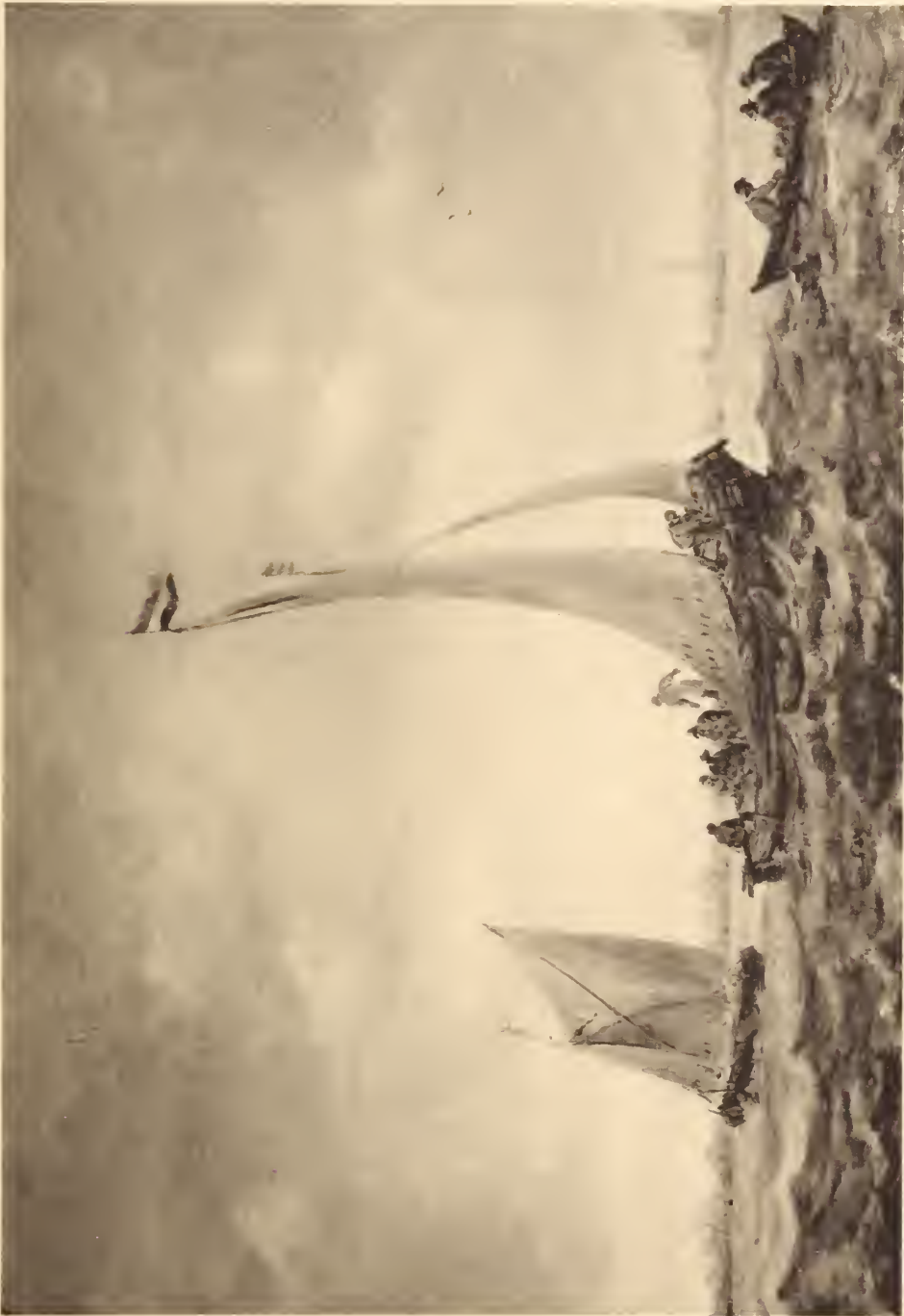
View of the harbor of Amsterdam, 1864. (Arch. V. G. Goyen)